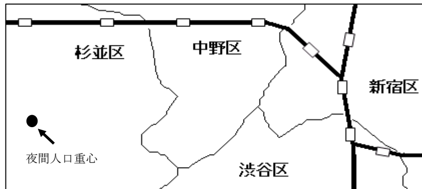
図1 東京都の夜間人口重心

※ 夜間人口重心は区市町村の基本単位別集計を用いて計算した。この基本単位区とは街区又は街区に準じた地域を基準とした地域単位をいいます。