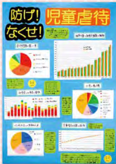
第4部 東京都知事賞