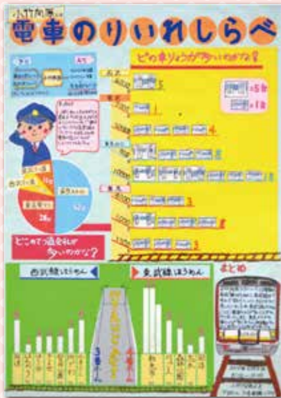
第1部 東京都知事賞