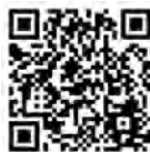
人口データ検索ガイド

東京都の人口データを中心に、調べたいデータを参照（リンク）できる便利な検索機能を掲載しています。