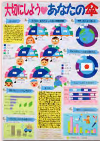
第3部 東京都知事賞