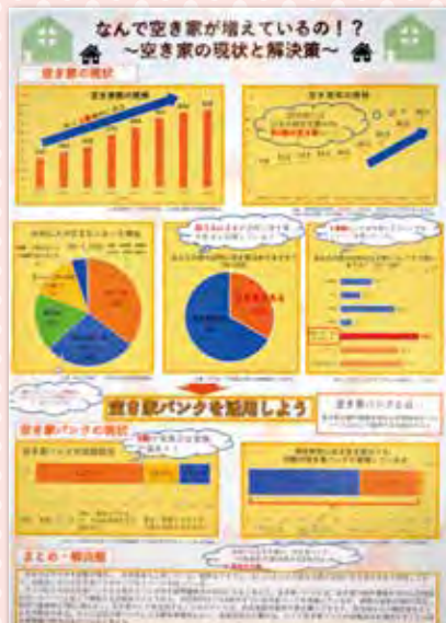
パソコン統計グラフの部 東京都知事賞