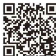
人口データ検索ガイド

東京都の人口データを中心に、調べたいデータを参照（リンク）できる便利な検索機能を掲載しています。