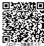
人口データ検索ガイド

東京都の人口データを中心に、調べたいデータを参照（リンク）できる便利な検索機能を掲載しています。