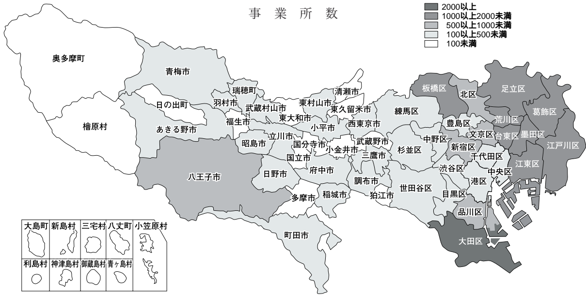
1 工業統計地図（従業者4人以上）